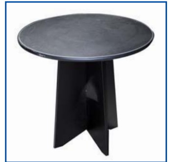
Tavolo rotondo grande cm 75x82 Pezzi n° .....