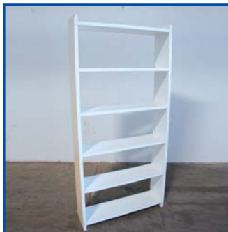
Scaffale 6 ripiani