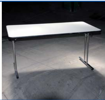
Tavolo in legno - cm 184x89 Pezzi n° .....