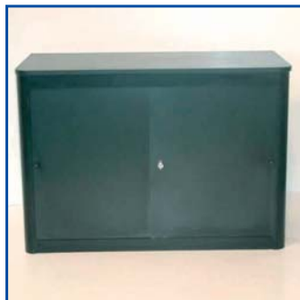
Armadietto basso bianco cm 90x43x70 - Pezzi n° .....