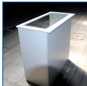
Banco reception bianco piano in vetro - cm 100x100x50 Pezzi n° .....