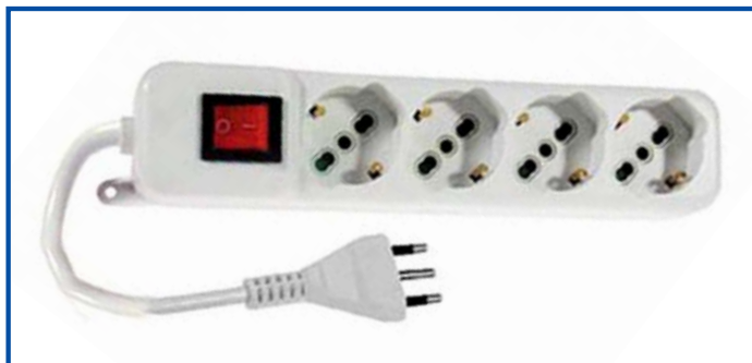
Ciabatta 4 prese