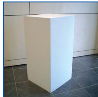
Cubo - varie misure