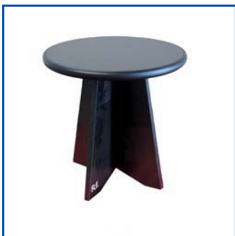
Tavolo rotondo piccolo cm 42x42 Pezzi n° .....