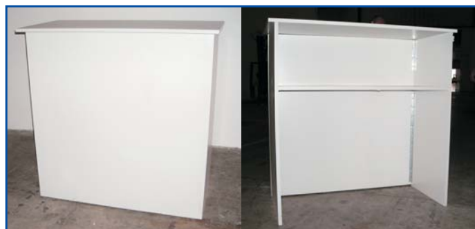
Banco reception bianco cm 100x100x50 Pezzi n° .....