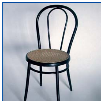
Sedia Thonet Pezzi n° .....