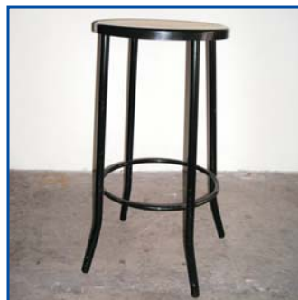
Sgabello Thonet - Pezzi n° .....