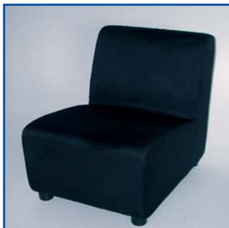
Poltrona nera Pezzi n° .....