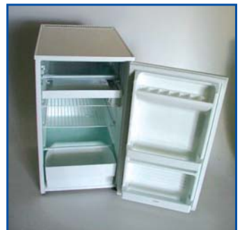
Frigo 70 LT. Pezzi n° .....