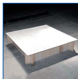
Pedana cm 120x120

H. cm 10 - 25 - 40 Pezzi n° ..... € 45,00