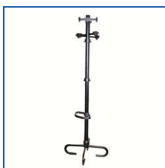
Appendiabiti a stelo