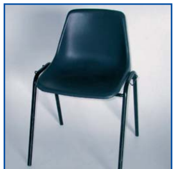
Sedia a scocca Pezzi n° .....