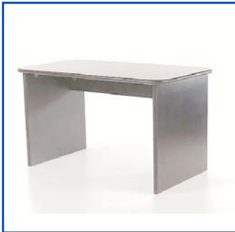
Scrivania - cm 147x80 Pezzi n° .....