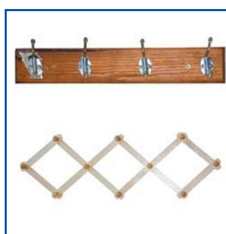
Appendiabiti a muro